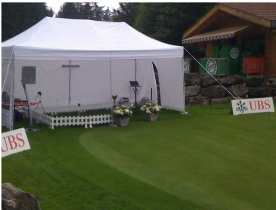
UBS Putting Klinik Gstaad ProAm

Dieses Paket richtet sich an Unternehmen welche dem Management und/oder Kunden einen einzigartigen Anlass bieten möchten. Maximal 10 Personen geniessen während einem ganzen Tag