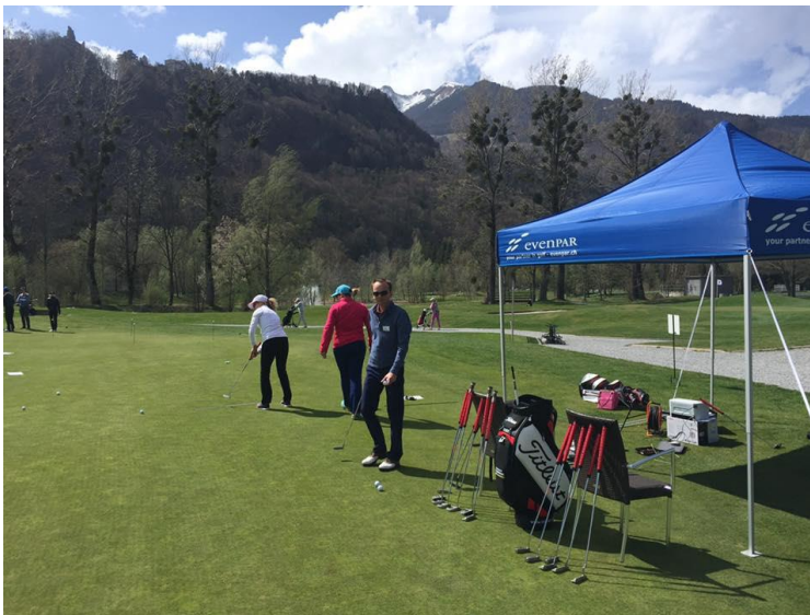
Putt Klinik im GC Heidiland

Im Jahr 2015 wurde die erste Puttklinik im GC Heidiland erfolgreich durchgeführt. Ein ganzer Tag rund um das Thema Putting: