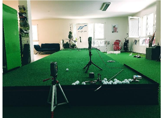
Putt Competence Center evenPAR

Seit 2004 beschäftigt sich die evenPAR neben anderen Kompetenzfeldern intensiv mit dem Thema Putting. Dabei hat sich die evenPAR in den vergangenen Jahren ein grosses Wissen rund um das Thema Putting aufgebaut. Nach 2 Jahren Putt-Coaching auf der Ladies European Tour und hunderten von Analysen von Amateuren, eröffnete die evenPAR im Oktober 2010 das erste Putt Competence Center der Schweiz. Das Center in Schlieren/ZH verfügt über die modernste Infrastruktur, sowie eine eigene Werkstatt in welcher die Putter individuell und umgehend angepasst werden können.